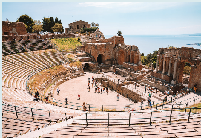
Teatr grecki w Taorminie

Poczucie, jakby zamiast na włoską wyspę trafiło się do Grecji: imponujące ruiny świątyni w Agrigento, gdzie oddawano cześć Zeusowi, Herze, Hefajstosowi i innym postaciom z greckiego panteonu. Zob. s. 91.