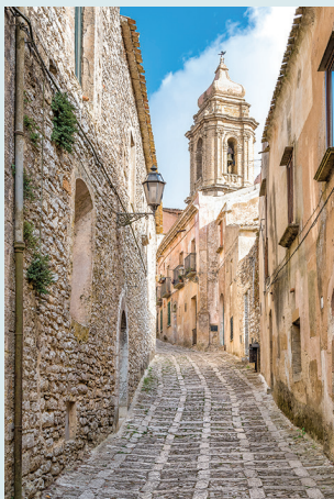
Uliczka w Erice

Udział w kolorowym widowisku: spektaklu teatru marionetek, przedstawiającym rycerzy, królów, księżniczki i smoki, pełnym intryg i pojedynków. Zob. s. 37.